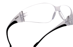
BANXSCI sin cordón

Tratamientos antirayaduras, antivaho, antiestático (según versiones)