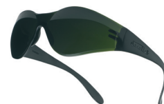
BANWPCC5 sin cordón